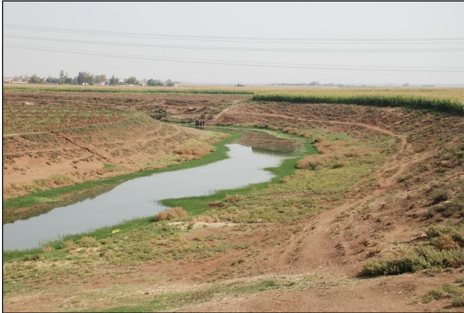
Nahezu ausgetrocknetes Flussbett des Chabur im Nordosten Syriens (Oktober 2009)

In diesem Jahr erstmalig dabei sind die Aufwände, die der Stadt Wetter durch die Aufnahme und Unterbringung von Flüchtlingen entstanden sind. Die geplanten Aufwände für Flüchtlinge lagen in Wetter bei 4,9 Mio. €, dabei wurden ca. 3 Mio. € vom Land getragen.